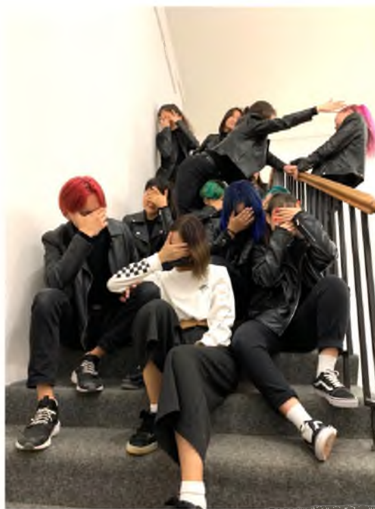
Фото 1. Танцоры- k-pop-еры на выступлении K-pop cover challenge в 2019 г.

вают самостоятельно или вместе с родителями. Однако и здесь наиболее важным условием выбора костюмов остается их удобство и свобода движений. К примеру, для типа танца Vogue с его характерной вычурной, манерной походкой лучше подойдут облегающие эластичные лосины, открытые купальники с глубоким вырезом, подчеркивающие сексуальность, и массивные аксессуары (серьги или браслеты), а для Blackpink можно надеть базовую однотонную футболку из хлопка и удобные брюки. В обоих случаях танцевальный костюм для выступлений не будет иметь четких гендерных признаков.