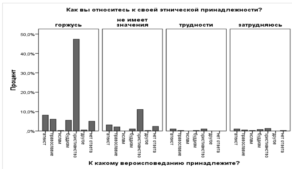
Рис. 1. Распределение ответов на вопрос «К какому вероисповеданию Вы принадлежите?»