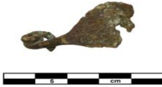
Рис. 3. Фибула бронзовая. Курган 20, погребение 1. Фото