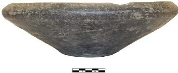
Рис. 5. Миска. Курган 3, погребение 1. Фото