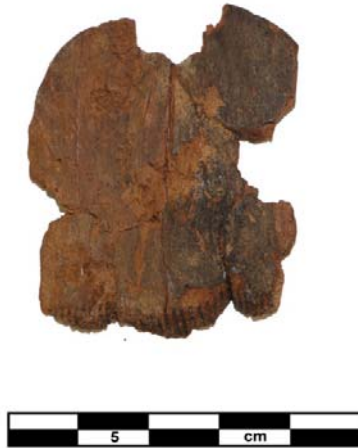
Рис. 4. Гребень деревянный. Курган 27, погребение 9. Фото