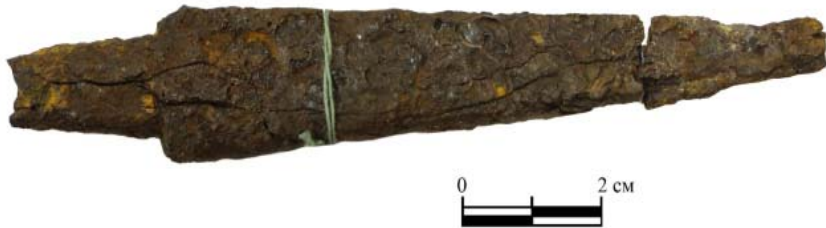
Рис. 6. Нож. Курган 29, погребение 1. Фото