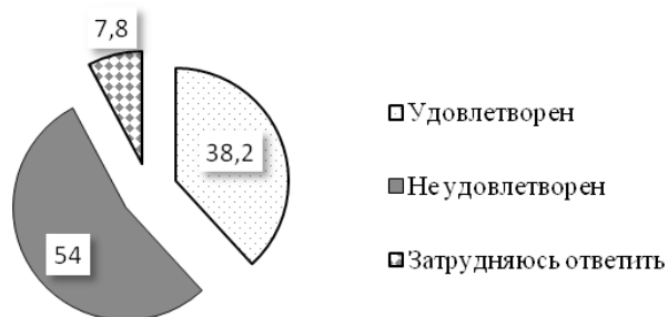
Рис. 1. Ответы респондентов на вопрос «Удовлетворены ли Вы качеством услуг по благоустройству в Вашем населенном пункте?» (Сводные данные по РК, в %)

Как видно из полученных данных, удовлетворены качеством услуг по благоустройству в своем населенном пункте немногим более трети (38,2 %) жителей республики. Более половины (54,0 %) жителей не удовлетворены организацией услуг по благоустройству населенных пунктов. 7,8 % респондентов не смогли дать определенного ответа на поставленный вопрос.