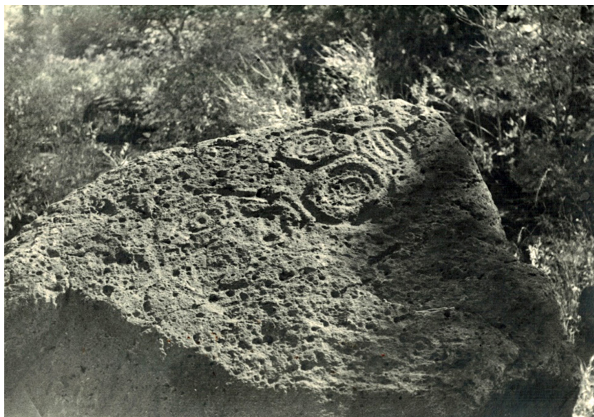
Фото 1. Сикачи-Алян — Малышево. Камень № 57 [Окладников 1971: 201; табл. 65].

Можно предполагать опоясывание «линией-змеей» всей личины от правого глаза с головой змеи до хвоста, соединенного с головой.