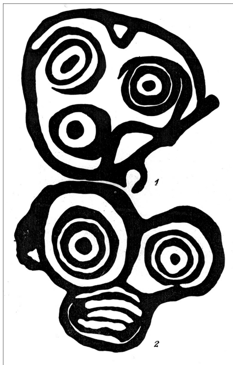
Рис. 1, 2. Сикачи-Алян — Мальшево. Камень № 57: 1, 2 (прорисовка по: [Окладников 1971: 201])

гибко изогнутой между глаз, и затем огибает правый глаз. Левый глаз создан широким углубленно-рельефным кругом с крупной ямкой-зрачком в центре.