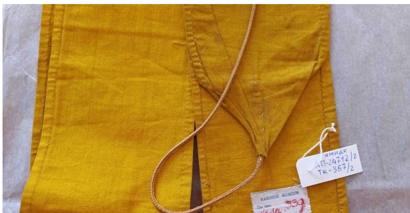
Фото 1. Элемент головного убора буддийского священнослужителя из фондов Новочеркасского музея истории Донского казачества, инв. № КП-24712/2. ТК-367/2

ра Николая II от престола, 4 апреля 1917 г., когда Военным ведомством было предписано всем частям войск доставить знамена и штандарты с вензелем отрекшегося императора, казаки приказ не выполняли, нашивая куски ткани под цвет полотна на вензель [Зайцева 2007: 133]. В годы Гражданской войны «святыни снова спасали, увозили с собой в эмиграцию. Размещали на хранение в православных церквях» [Агафонов 2013: 294]. Но именно этот поступок, который можно расценивать как неспасение знамени противнику, позволил сохранить его, а спустя годы вернуть в родные земли. Так, в 1946 г. из Пражского национального музея были возвращены 2 750 предметов из числа ценностей Донского музея, вывезенных белыми казаками в 1919 г., о чем свидетельствуют штампы с инвентарными номерами «Народного музея» (см. фото 1).