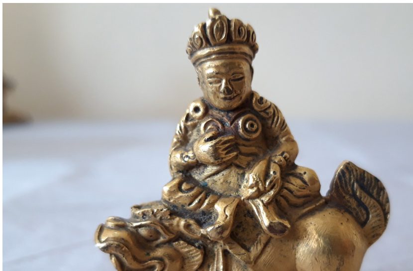
Фото 2. Вайшравана. Статуэтка из фондов Новочеркасского музея истории Донского казачества, инв. № КП-1997. Пр.-902

(см. фото 2). Эти экспонаты нуждаются в детальной атрибуции, которая позволит определить дату и место их изготовления. Безусловно, калмыцкие мастера умели отливать и изготавливать статуэтки буддийских божеств. Производство таких изделий находилось при монастырях и регулировалось каноническими правилами. Отливка статуэток из бронзы производилась методом «замещения воска» или «утраченной восковой фигуры». Экспонат, значащийся как «божок на мифическом звере», на наш взгляд, — это божество богатства Намсарай (санскр. Вайшравана), восседающий на белоснежном льве, известный также под именами Дзамбала или Кубера. Его обычные атрибуты: в правой руке — знамя победы, в левой — мангуста, животное, символизирующее благосостояние и богатство, отрывающее драгоценные камни. В экспонате из Новочеркасского музея отсутствует первый атрибут, но присутствует второй.