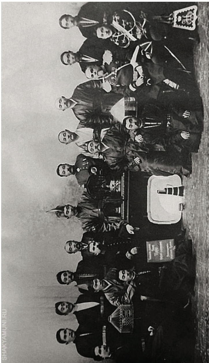
Фото 4. Депутация астраханских калмыков в Царском Селе. 17 февраля 1909 г.