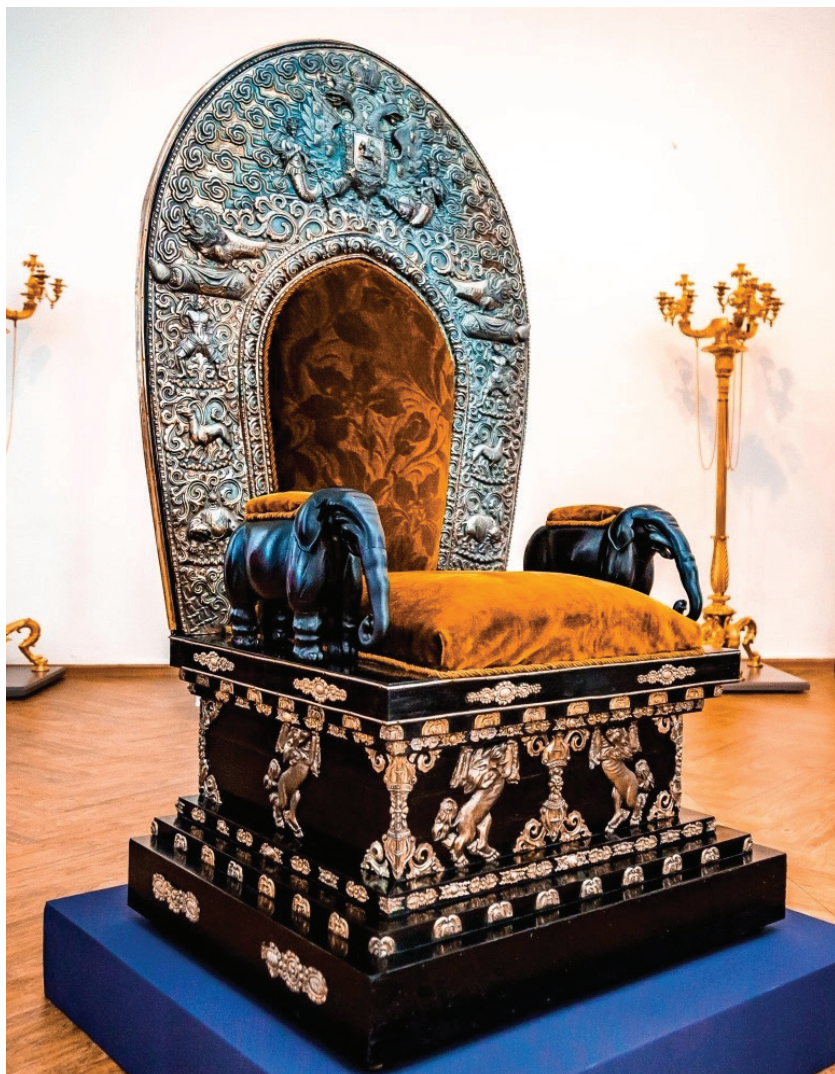
Фото 3. Тронное кресло императрицы, подаренное депутацией донских калмыков в 1908 г.