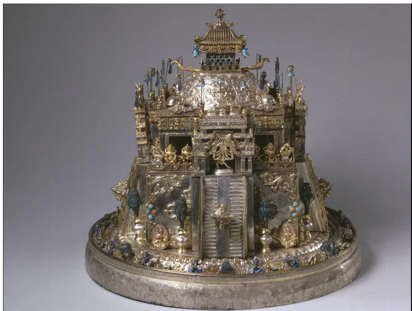
Фото 2. Мандала «13 божеств сферы Шри Ваджрабхайравы», коллекционный номер 2150-1.