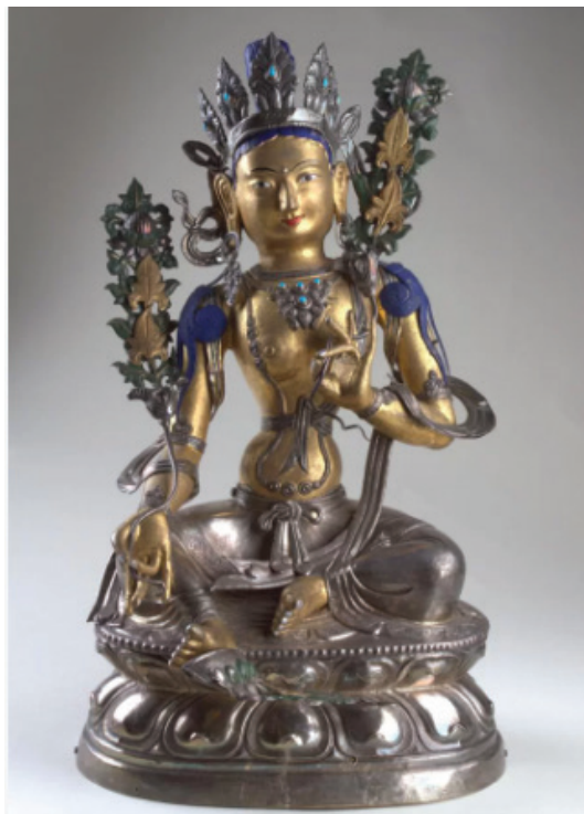
Фото 5. Скульптура божества Тара (Дара эк).

Буддийское божество Гетлгч Дара-эхе — бодхисаттва Тара (калм. Дэрк, Дэри эк ), спасительница — наиболее популярный женский образ в буддийском пантеоне божеств в тибетском буддизме. По утверждению современных исследователей в области лингвистики, теоним «Дэрк» смешанного калмыцко-санскритско-