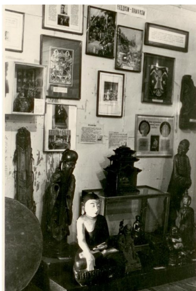
Фото 7. Фрагменты экспозиции отдела истории религии и атеизма СМК (Фотографии с инв. №№: ФОТ 4148, ФОТ 4147)

антирелигиозной политики власти Советов на территории Калмыкии в первой трети XX в. Основные даты поступления, прежде всего, предметов буддийского культа, относятся к 1929 г. и 1932–1933 гг. Если в разные годы поступали единичные предметы, то в указанные годы состоялись массовые поступления. Именно в это время происходит усиление борьбы с инакомыслием, в ходе которой уничтожаются предметы самобытной буддийской культуры калмыцкого народа, каждый из которых представляет не только материальную ценность, но и научную. Благодаря деятельности ученых, в том числе и сотрудников Саратовского музея краеведения, в рамках антирелигиозной кампании, удалось сохранить бесценные артефакты буддийского культа калмыков.