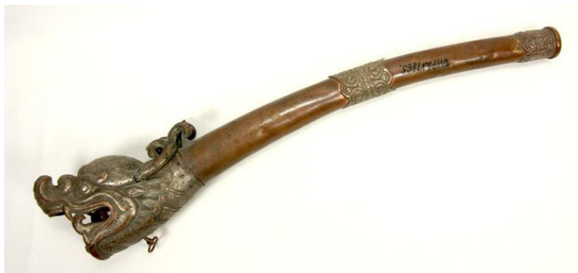
Фото 6. Ритуальный музыкальный инструмент ганглин, инв. № КП СМК 7186 1

СОМК № 4. Л. 29об.]. Скульптура высотой 8,8 см, изготовленная из глины способом формовки и покрытая лаком, датирована концом XIX – началом XX в. и поступила в хорошем состоянии.