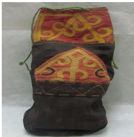
Фото 1. Кисет для табака, инв. № КП СМК 4076 1 .

Как следует из сведений, представленных в табл. 1, первый экспонат поступил в Саратовский музей в 1907 г. из Икицохуровского улуса Калмыцкой степи Астраханской губернии. Это кисет для табака размером 30 x 15 см, сшитый из черной ситцевой материи и украшенный вышивкой в виде растительного орнамента. В верхней его части продета зеленая шерстяная тесьма, служащая затвором. Фотография 1 свидетельствует о хорошей сохранности экспоната [КП СОМК № 4. Л. 20об.].