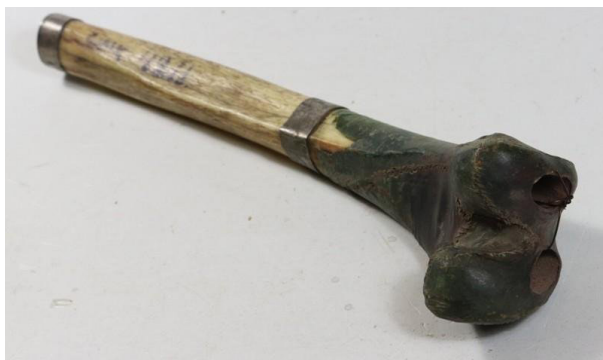
Фото 5. Ритуальный музыкальный инструмент — ганглин, инв. № КП СМК 4211 1 .

Нарушая хронологический принцип, приведем данные об экспонате из еще одного буддийского храма Чееря-хурула Манычско-го улуса. В 1907 г. при храме была открыта высшая духовная академия [НА РК. Ф. И-9. Оп. 5. Д. 2750. Л. 145]. В 1933 г. в Саратов был доставлен духовой амбушюрный инструмент — ганглин. При его регистрации в книге поступлений записано: «труба из человеческой кости маленькая буддийская, для созыва на молитву» [КП СОМК 4. Л. 36об.]. На фото 5 видны два отверстия в передней части инструмента, которые называются «лошадиные ноздри».