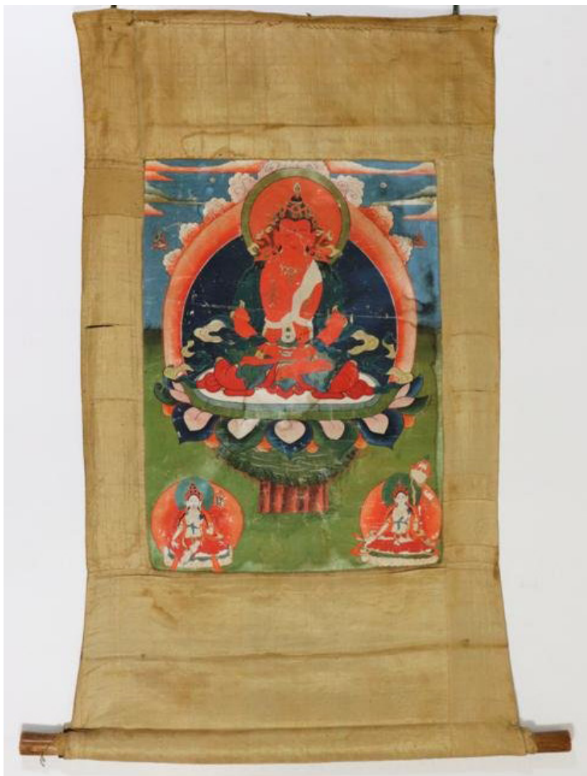
Фото 2. Буддийская танка «Будда Амигаюс», инв. № КП СМК 4184 1