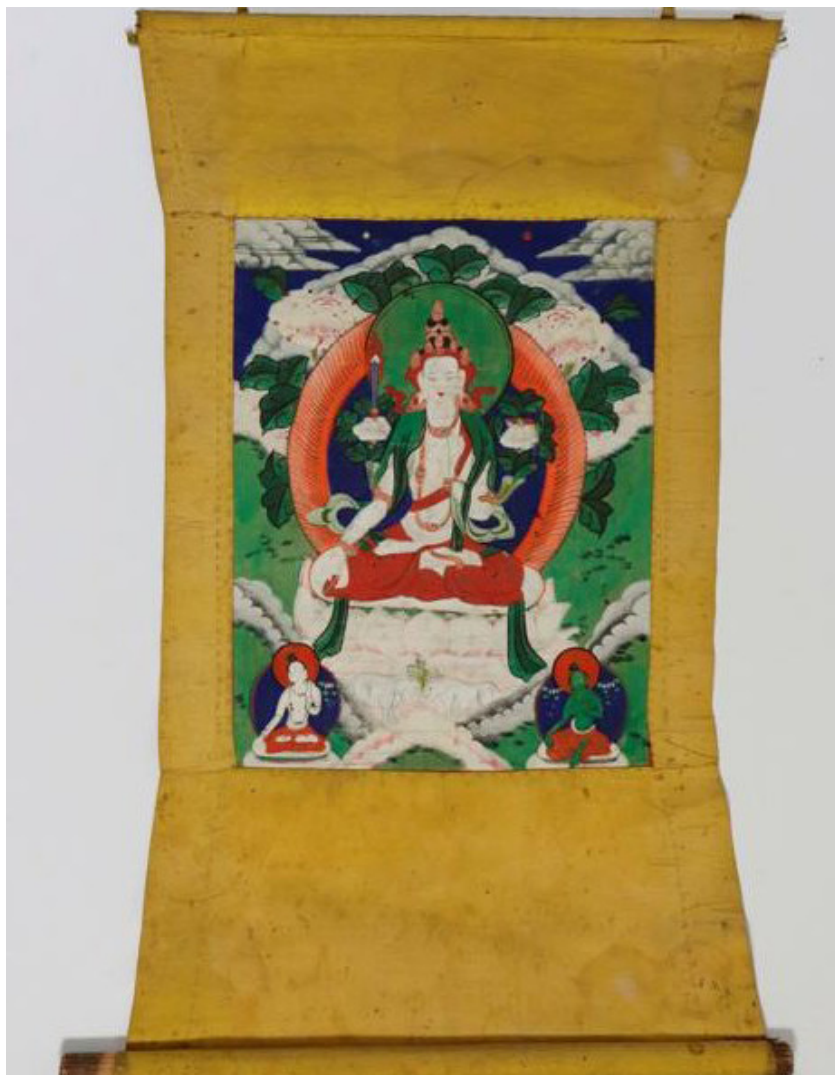
Фото 3. Буддийская танка «Ботхисаттва», инв. № КП СМК 7009 1