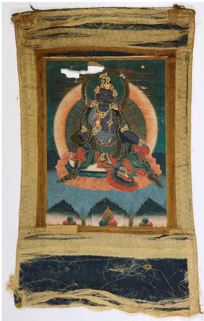
Фото 4. Буддийская танка «Синяя Тара», инв. № КП СМК 4186 1