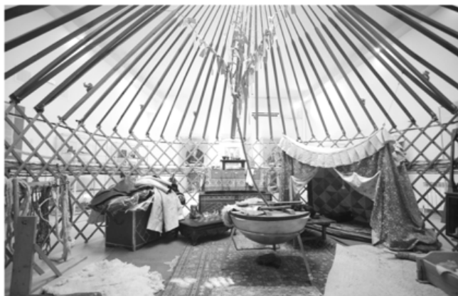
Музей калмыцкой традиционной культуры имени Зая-пандиты Калмыцкого научного центра Российской академии наук

Войлочная коллекция Музея имени Зая-пандиты Калмыцкого научного центра РАН, как видно по обзору, сравнительно немногочисленна, но достаточно разнообразна по своему составу. Будучи в постоянной экспозиции войлоки представляют характерный материал животноводческого хозяйства монголоязычных nomads Центральной Азии и – шире – Евразии. В пространстве музейной экспозиции предметы быта, концептуально собранные в ансамбле интерьера калмыцкой кибитки «ишкэ гер» и вокруг нее, воспринимаются в качестве универсального кода этнической культуры. В традиционных предметах аккумулирована система мироощущения и созидания, транслирующая древний социокультурный опыт монголоязычных народов.