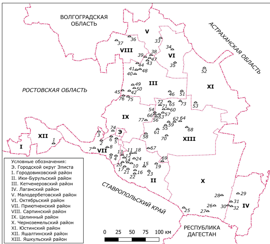
Рис. 1. Курганы на территории Калмыкии, обозначенные на военных картах РККА (1925–1941 гг.)