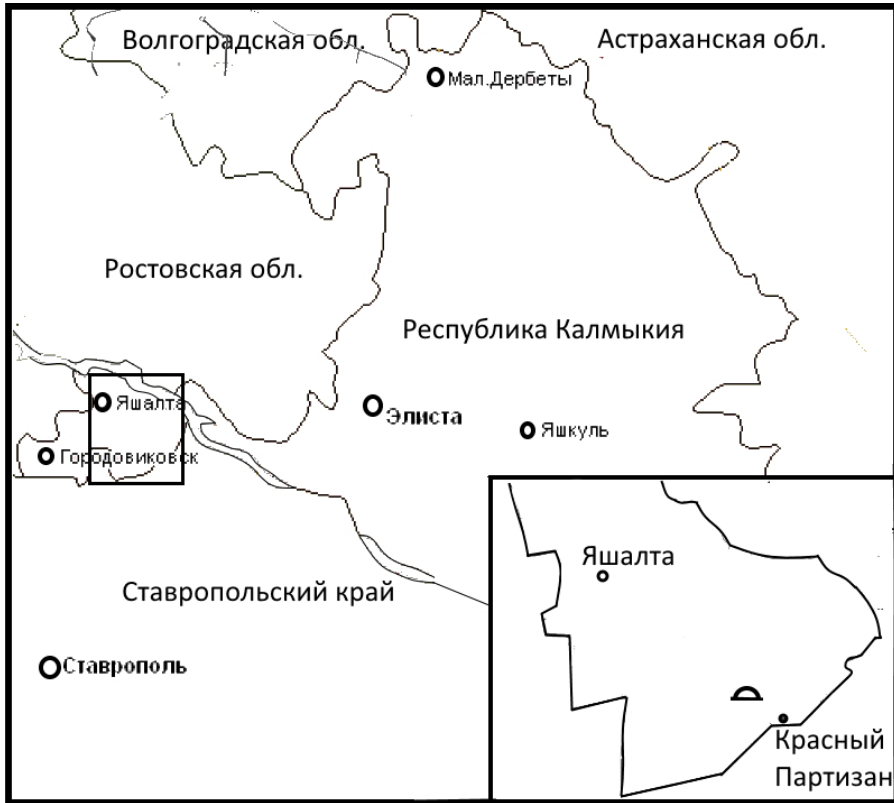
Рис. 1. Географическое расположение курганной группы Красный Партизан . Яшалтинский район Республики Калмыкия