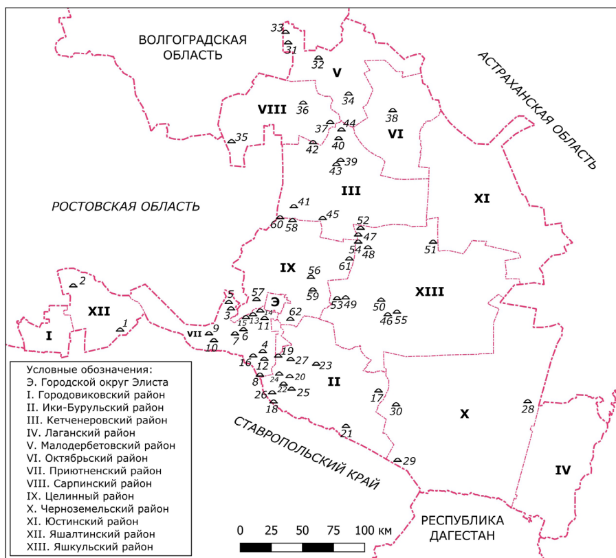
Рис. 2. Курганы на территории современной Республики Калмыкия, обозначенные на картах 2-й пол. XX в.

Цифрами обозначены: 1. курган Верблюд; 2. курган Хартолга; 3. курган Братта; 4. курган Глубокая Балка; 5. курган Годжур; 6. курган Мергень-Тоухун; 7. курган Мергень-Адрик; 8. курган Мухтинский; 9. курган Никаноров; 10. курган Придорожный; 11. курган Три Брата; 12. курган Таун-Адрык; 13. курган Хамур; 14. курган Хатинский; 15. курганы Хурул; 16. курган Шаурта; 17. курган Близнец; 18. курган Зунда-Толга; 19. курган Зюрган-Зо; 20. курган Ивля; 21. бугор Пять курганов; 22. курган Санджин-Сала; 23. курган Торунтын; 24. курган Хоюр-Болдун; 25. курган Хундулан; 26. курган Цаган-Ташу-Толга; 27. курган Шашын-Толга; 28. бугор Барун-Толга; 29. курган Кордон-Толга; 30. курган Цепной; 31. курганы Водинские; 32. курган Ильков; 33. курганы Отрезенские; 34. курган Сага-Толга; 35. курганы Доменские; 36. курган Перепелкин; 37. курган Совкин Хар-Толга; 38. курган Касьянова Толга; 39. курган Гал-Толга; 40. курган Горвун-Адрык; 41. курган Каменный; 42. курган Нугра-Толга; 43. курган Цаган-Толга; 44. курган Чоха-Толга; 45. курган Шар-Дарялык; 46. курган Ацха-Хар-Толга; 47. курган Итлик-Толга; 48. курган Тесерка-Энкрик-Толга; 49. курган Унгуцунур; 50. курган Хар-Толга; 51. курган Херена-Худук; 52. бугор Цаган-Толга; 53. курганы Чилгирские; 54. курган Шарва-Толга; 55. бугор Ялман-Улан-Толга; 56. курган Бор-Нур; 57. курган Джальдже; 58. курганы Мугатинские; 59. курган Муктын-Толга; 60. урочище Пять курганов; 61. курган Теремтин-Толга; 62. курган Шокуньский.