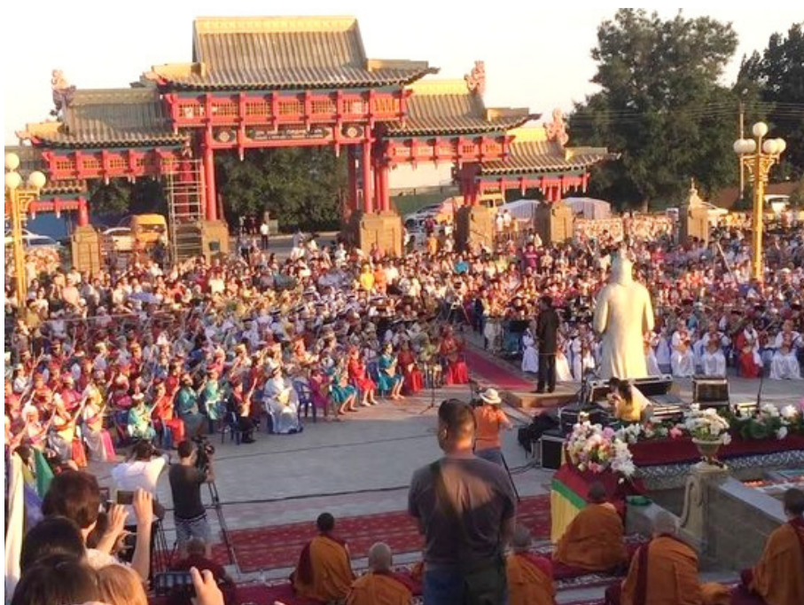
Музыкальное подношение сводного оркестра музыкантов Калмыкии – 2019.

линного района РК, признанный победителем всероссийского конкурса «Российское дерево года 2019» [Национальный конкурс...]. Кроме того, в Лаганском районе РК ежегодно проходит фестиваль лотосов и проводятся при поддержке Министерства культуры и туризма РК, других учреждений, ведомств, организаций мероприятия событийного туризма. К примеру, с 2014 г. ежегодно расширяется мероприятие «Музыкальное подношение сводного оркестра музыкантов Калмыкии» [В Калмыцком хуруле...]. В 2019 г. в музыкальном подношении принимал участие сводный оркестр из 700 музыкантов: уникальное мероприятие является не просто концертом, а религиозным подношением буддийским Трем драгоценностям — Будде, Дхарме, Сангхе, которое совершается один раз в году и направлено на развитие национальной культуры, поддержание ее традиций. По результатам Всероссийского конкурса в области событийного туризма «Russian open Event Expo» в 2019 г. это мероприятие стало лауреатом II степени в номинации «Лучшее культурное событие с участием профессиональных коллективов» [Калмыцкий фестиваль тюльпанов...; Калмыкия одержала победу...].