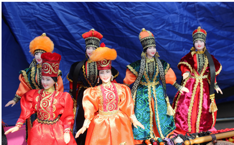
Сувенирные куклы (фото Т.И. Шараевой, 2019 г.).

Многие мастера стали принимать участие в выставках-продажах, проходящих в г. Элиста во время туристического сезона. Первоначально мастера-кукольники принимали участие в различных выставках декоративно-прикладных изделий, но в последнее время стали больше отдавать готовые куклы на реализацию.