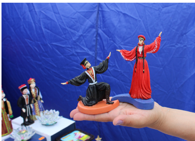
Танцующая пара из холодного фарфора. Выставка–продажа на праздничном мероприятии «День города» в г. Элиста (фото Т.И. Шараевой, 2019 г.).

С другой стороны, сдерживающим фактором массового производства сувенирных кукол является длительность процесса их изготовления, трудоемкость и высокая стоимость (рыночная стоимость составляет в среднем от 800 до 2 тыс. рублей). Это, соответственно, приводит к низкому уровню продаж, некупаемости затраченных материалов, времени, коммунальных услуг. По объяснениям мастеров, этническим предпринимателям, работающим в сфере туризма и сувенирной продукции, проще закупать оптом деревянные заготовки кукол в соседних регионах, в Республике Бурятия и Монголии, лица которых уже имеют восточные