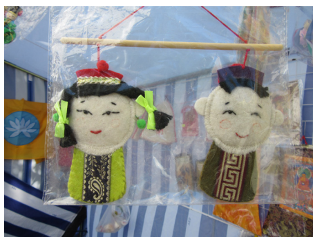
Куклы-невелички из войлока работы Е.Л. Адьяевой.

Широкое распространение получили куклы-невелички из фетра и войлока, полностью тканевые куклы.