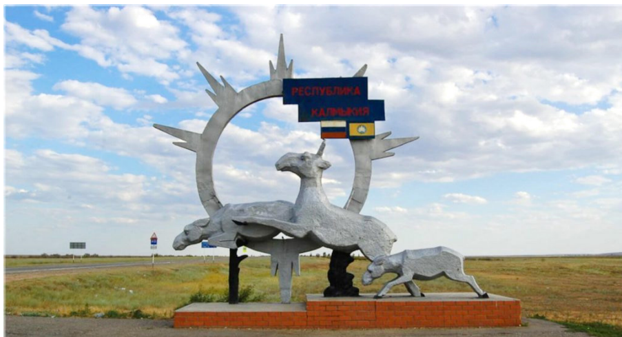
Знак на границе Республики Калмыкии при въезде из Волгоградской области

В Калмыкии работа по развитию сельского и экологического туризма, народных промыслов развивалась постепенно. Ее задача — развитие экологической культуры, а также повышение уровня знаний во благо сохранения природного и культурного наследия.