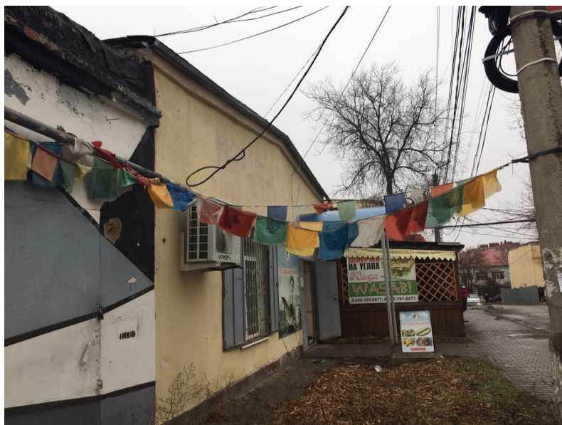
Ки мөрн на общественном здании в г. Элиста (улица М. Горького, д. 25).