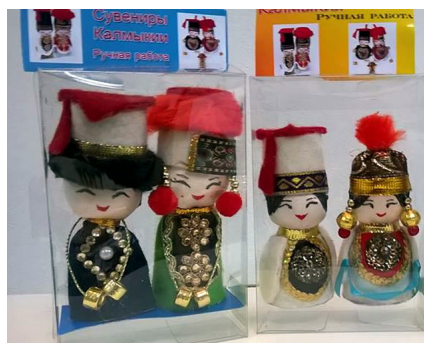
Куклы-невелички из ткани и войлока