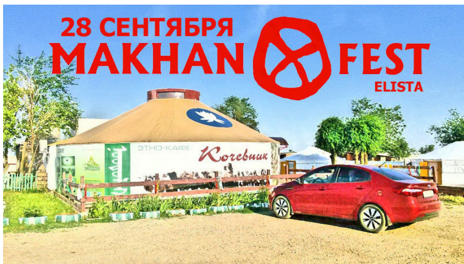
Рекламный проспект гастрономического фестиваля.

В процессе его реализации были востребованы идеи и были привлечены к работе предприниматели, связанные с этническими традициями.