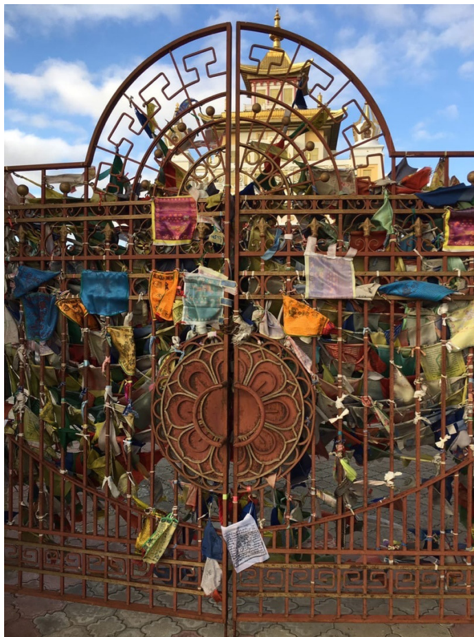
Ки мөрн на главных воротах храма «Бурхн Багшин алтн сүм»

лер 1997: 22–23]. Согласно наблюдениям автора статьи, городской зоной, где в настоящее время чаще всего вешают ки мөрн , является центральный храм Калмыкии «Золотая обитель Будды Шакьямуни» ( Бурхн Багшин алтн сүм ). Здесь молитвенные флажки развешаны вдоль всей ограды здания. Вход на территорию осуществляется с каждой из четырех сторон, но наибольшая плотность ки мөрн фиксируется на главных южных воротах.