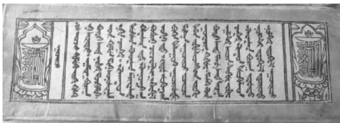
Лист ксилографа «Хутуqtu билигийин ċinadu күрүqсен тасулуqċи оċир кемёкү yeке көлqөнi судур ороšibo» из коллекции Утнасна Хошуда

формы букв «z» и «с» «ясного письма»), которыми отпечатан ксилограф. Они были приняты в СУАР КНР в 60-е гг. XX в.