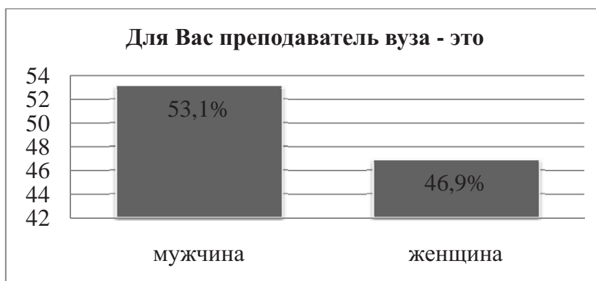
Рисунок 2. Распределение ответов на вопрос: «Для Вас преподаватель вуза — это»

Как уже было сказано выше, в современной высшей школе число профессорско-преподавательского состава сокращается, кроме этого, статистика показывает, что наблюдаются такие процессы, как старение и гендерный дисбаланс в профессии. Но в общественном сознании уход мужчин из преподавательской профессии еще не зафиксирован: на вопрос «Для Вас преподаватель вуза — это» 53,1 % респондентов ответили, что это мужчина; 46,9 % — женщина (см. рис. 2). В ответах респондентов разных категорий по полу, году получения высшего образования и других критериев различий не выявлено.