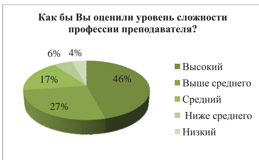
Рисунок 4. Распределение ответов на вопрос «Как бы Вы оценили уровень сложности профессии преподавателя?»

На рисунке 4 показан уровень сложности профессии преподавателя.