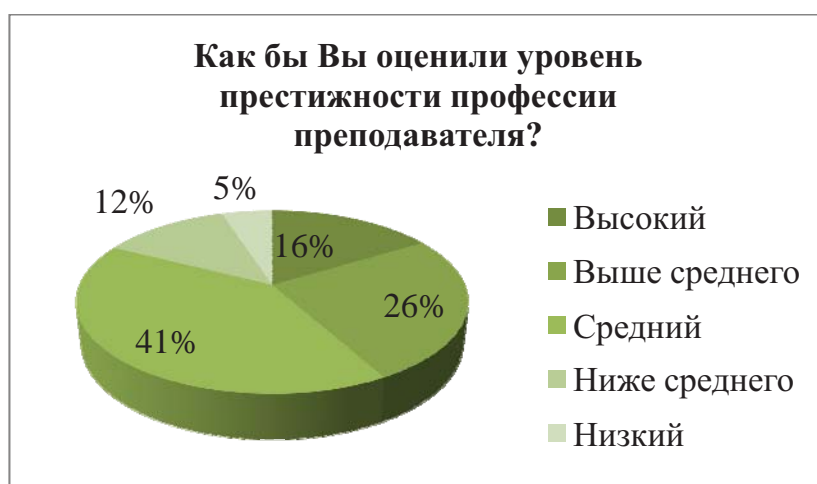
Рисунок 3. Распределение ответов на вопрос «Как бы Вы оценили уровень престижности профессии преподавателя?»

лагают различный контроль над ресурсами. Профессии по-разному вознаграждаются как материально, так и символически, и поэтому одни занятия более престижны, нежели другие. На рисунке 3 представлены данные об оценке уровня престижности профессии преподавателя в современном обществе.