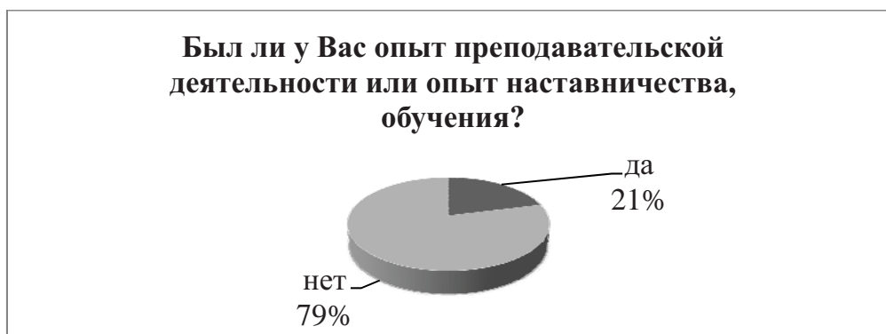
Рисунок 1. Распределение ответов на вопрос «Был ли у Вас опыт преподавательской деятельности или опыт наставничества, обучения?»

На рисунке 1 представлены данные о том, был ли у опрошенных опыт преподавательской деятельности или опыт наставничества, обучения. Как мы видим, только у 21 % опрошенных был опыт преподавательской деятельности или опыт наставничества, обучения. У остальных 79 % такой опыт отсутствует.