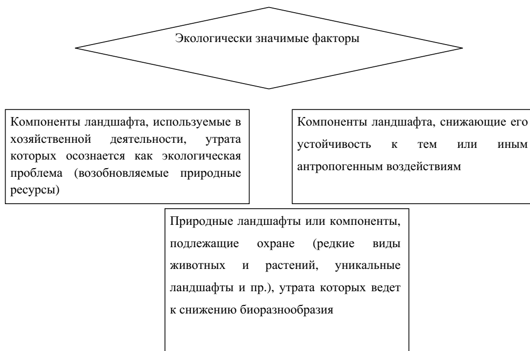
Схема 1. Экологически значимые факторы

ний промысловых и охраняемых животных, истощение рыбных и пастбищных ресурсов, дестабилизация многолетних песчаных грунтов, активация опасных геоморфологических процессов, тепловое и химическое загрязнение атмосферы в результате сжигания попутного газа на факелах.