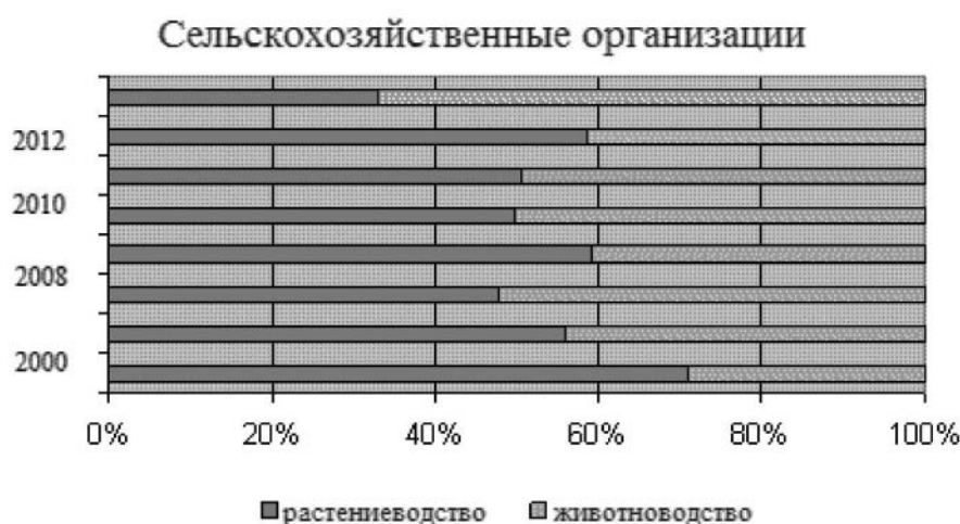
Рис. 1. Процентное соотношение специализаций сельскохозяйственных организаций РК [Стат. сборник по РК 2013]

На организацию и функционирование сельскохозяйственных кластеров Калмыкии, безусловно, влияют природные (аридная территория), экономические условия и факторы. Сельское хозяйство — это основная отрасль в Калмыкии (рис. 1). В состав агропромышленного комплекса республики входят 116 сельскохозяйственных предприятий, 4565 крестьянских (фермерских) хозяйств и более 60 тысяч личных подсобных и индивидуальных хозяйств. В хозяйствах всех категорий насчитывается поголовья: КРС более 604 тыс. гол., овец и коз — свыше 2400 тыс. гол.