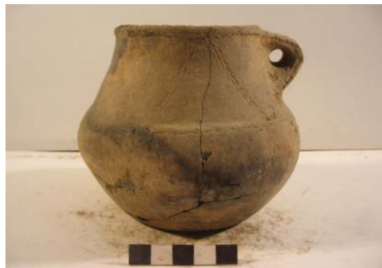
Рис. 3. Сосуд. Восточный Маныч правый берег, 1965 г. курган № 2, погребение № 3